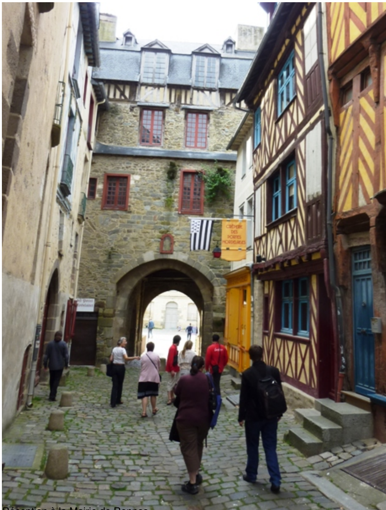
Réception à la Mairie de Rennes