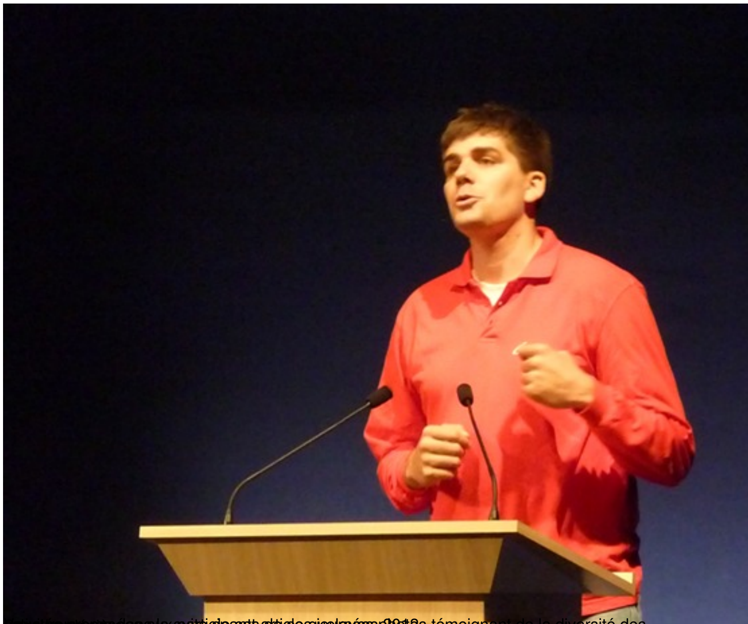
Les participants à la soirée de clôture des journées GPL 2012 témoignant de la diversité des