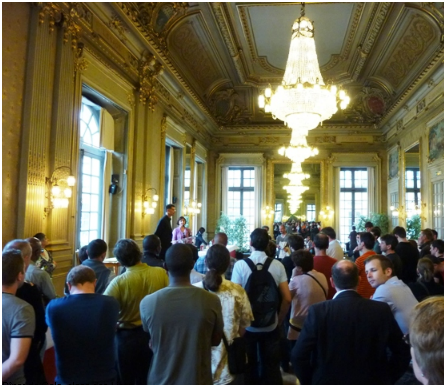
Dîner de Gala, place des Lices