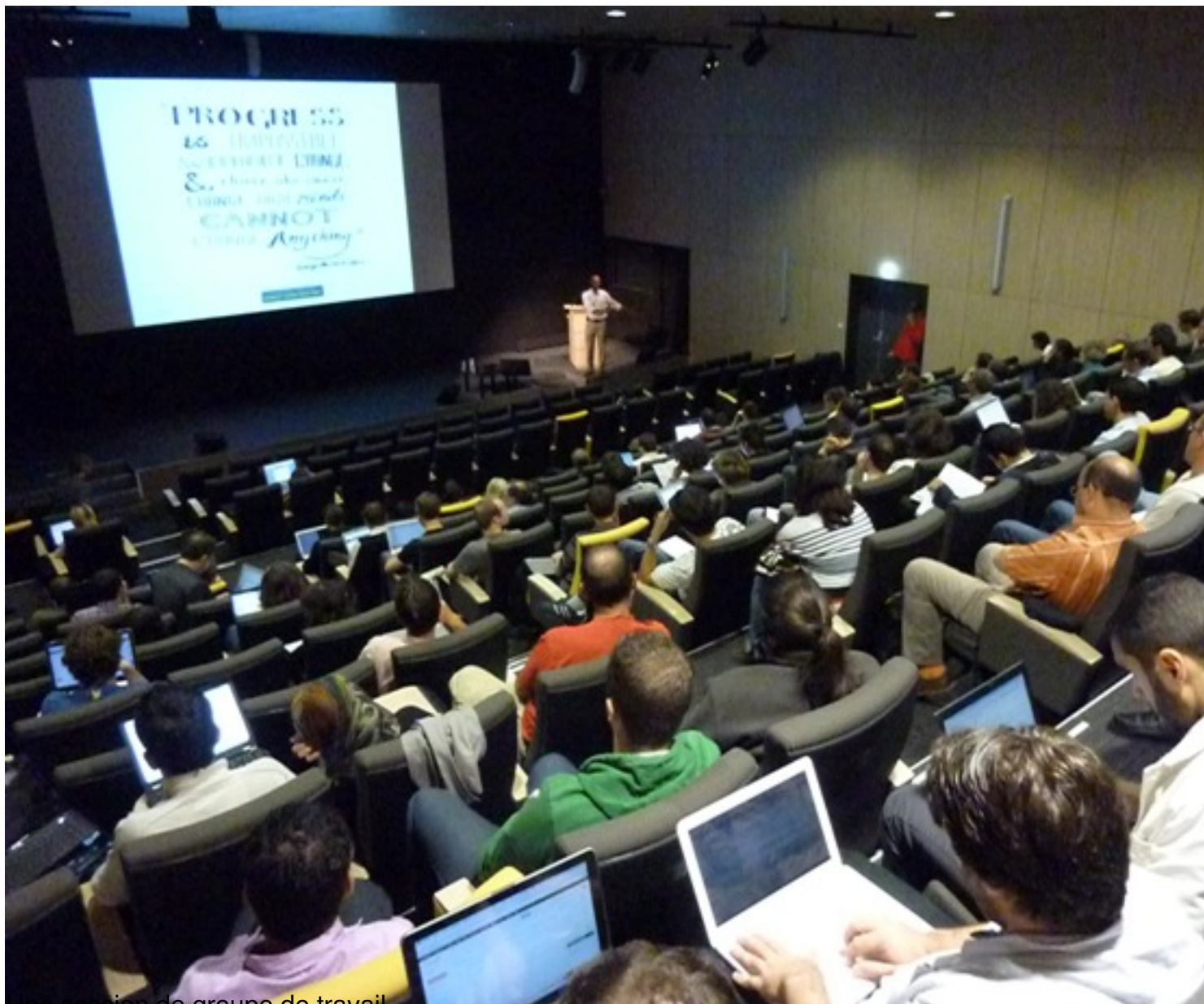
Une session de groupe de travail