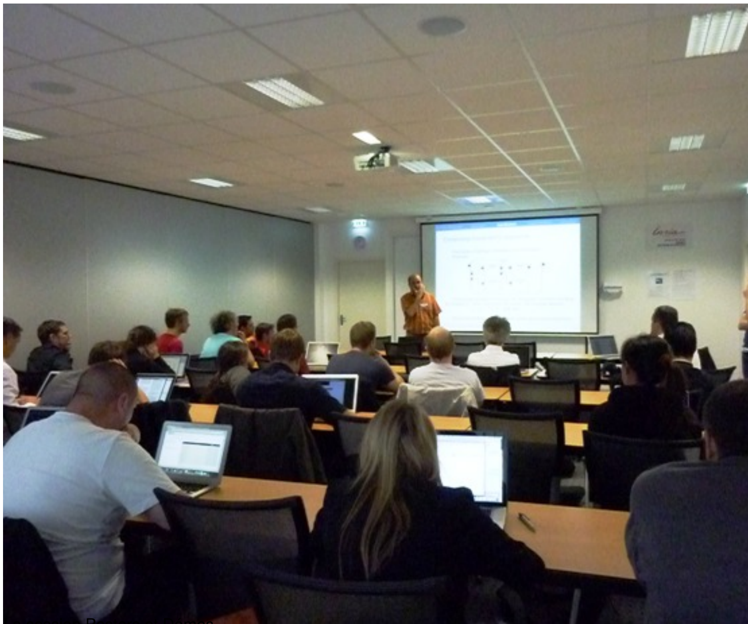
La session Posters et Demos